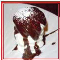
TORTA MERINGATA con cioccolato o senza €4,00