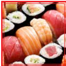
# 702. SUSHI MISTO PICCOLO 2 maki, 5 nigiri € 9,00