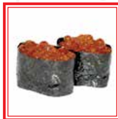
607. GUNKAN IKURA caviale di salmone* € 5,00

* PRODOTTI SURGELATI O CONSERVATI A BASSA TEMPERATURA Le foto dei piatti sono puramente indicative e hanno il solo scopo illustrativo.