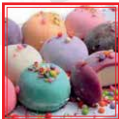
MIX MOCHI GELATO 3 pezzi € 5,50