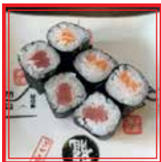
210. HOSO MAKI MISTI salmone e tonno € 5,00