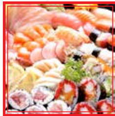
903. BARCA GRANDE 21 fette sashimi, 18 nigiri, 9 hosomaki, 12 uramaki e 2 gunkan € 60,00

# PIATTO A SCELTA TRA LE 5 PROPOSTE PER IL MENÙ A PREZZO FISSO DA EURO 25,00