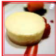
CHEESECAKE ALLO YUZU € 4,00