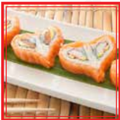
326. URA LOVE salmone, surimi*, philadelphia ed avocado € 9,50