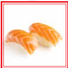
# 501. NIGIRI SAKE salmone € 3,00

2pz (polpettina di riso coperta da fettina di pesce)