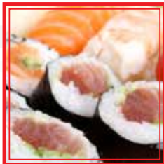
703. SUSHI MISTO MEDIO 4 maki, 8 nigiri € 14,00