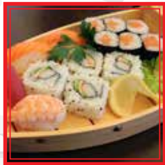
901. BARCA PICCOLA 7 fette sashimi, 6 nigiri, 3 hosomaki e 4 uramaki € 23,00