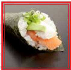
# 109. TEMAKI PHILADELPHIA salmone, philadelphia e avocado € 4,50