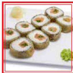
404. FUTO FRITTO salmone, surimi*, funghi giapponesi, rapa giapponese e avocado € 10,00

* PRODOTTI SURGELATI O CONSERVATI A BASSA TEMPERATURA Le foto dei piatti sono puramente indicative e hanno il solo scopo illustrativo.