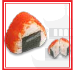
513. ONIGIRI EBI TOBIKO gambero e caviale* di pesce volante € 4,50