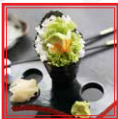
# 113. TEMAKI AVOCADO avocado e sesamo € 3,50

* PRODOTTI SURGELATI O CONSERVATI A BASSA TEMPERATURA Le foto dei piatti sono puramente indicative e hanno il solo scopo illustrativo.