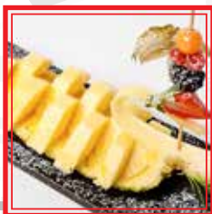
ANANAS FRESCO € 3,00

# PIATTO A SCELTA TRA LE 5 PROPOSTE PER IL MENÙ A PREZZO FISSO DA EURO 25,00