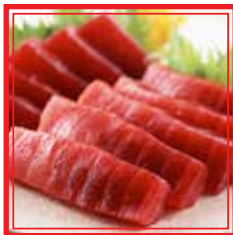
802. SASHIMI TEKKA 10 fette € 15,00