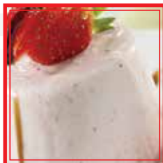
PANNA COTTA FRESCA € 3,50