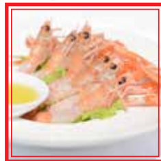
808. SASHIMI DI SCAMPI 5 pezzi € 9,00

* PRODOTTI SURGELATI O CONSERVATI A BASSA TEMPERATURA Le foto dei piatti sono puramente indicative e hanno il solo scopo illustrativo.