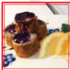
213. HOSO MAKI VULCAN salmone, gamberi e parmigiano € 6,50