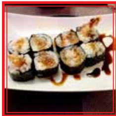
406. FUTO MAKI EBITEM tempura di gamberi*, insalata e avocado € 9,50