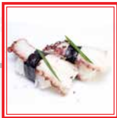
# 507. NIGIRI TAKO polipo cotto* € 3,00