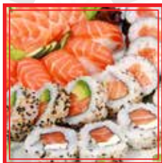
705. SUSHI SASHIMI 7 fette di sashimi, 4 nigiri, 3 hosomaki, 2 uramaki € 19,00