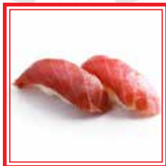
# 502. NIGIRI TEKKA tonno € 3,50