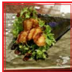
112. TEMAKI FRIED CHICKEN pollo fritto e insalata € 3,50