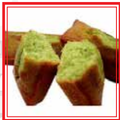
PLUMKAKE AL THÈ VERDE € 3,50