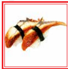
508. NIGIRI UNAGI anguilla € 3,50