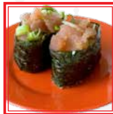
604. GUNKAN SPICY TUNA tonno, avocado e salsa piccante € 4,50