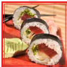
402. FUTO TUNA tonno e avocado € 9,50