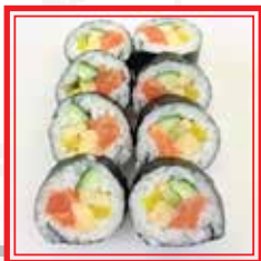
403. FUTO MAKI salmone, surimi*, funghi giapponesi, rapa giapponese e avocado € 9,50