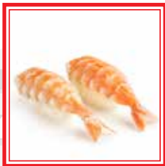
# 505. NIGIRI EBI gamberi* € 3,50