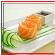
601. GUNKAN SALMON JOY fiori di salmone € 5,00

2pz (polpettina di riso coperta da ripieno avvolta da alga nori)