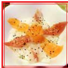
# 711. CHIRASHI MISTO € 14,00