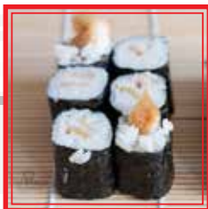
211. HOSO MAKI KARA-AGE pollo fritto € 4,50