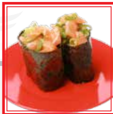
603. GUNKAN SPICY SALMON salmone, avocado e salsa piccante € 4,00