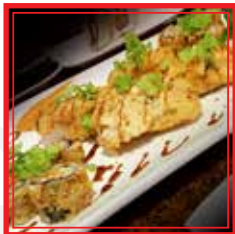
701. ALASKA SUSHI sushi fritto: 6 hosomaki, 4 nigiri € 12,50