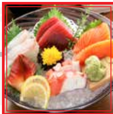
# 803. SASHIMI MISTO PICCOLO 8 fette € 12,00