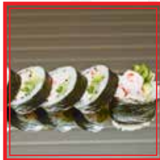
407. FUTO CALIFORNIA gamberi*, surimi*, insalata e avocado € 9,00