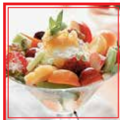
MACEDONIA FRESCA CON GELATO € 4,00