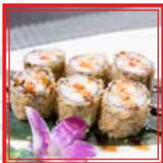
209. HOSO MAKI FRITTI salmone € 5,00