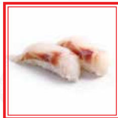
# 504. NIGIRI SUZUKI branzino € 3,00

# PIATTO A SCELTA TRA LE 5 PROPOSTE PER IL MENÙ A PREZZO FISSO DA EURO 25,00