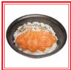
709. CHIRASHI SALMONE € 13,00