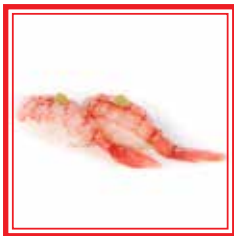
506. NIGIRI AMAEBI gamberi rossi crudi* € 4,00