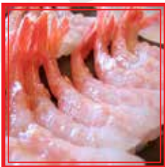
806. SASHIMI AMAEBI* 5 pezzi € 8,00