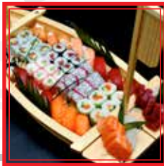
902. BARCA MEDIA 14 fette sashimi, 12 nigiri, 6 hosomaki, 8 uramaki e 2 gunkan € 43,00