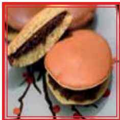
DORAYAKI dolce farcito con marmellata di fagioli dolci € 3,50