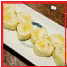
# 327. FRUITS ROLL banana e mango € 8,00