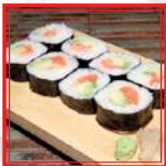
401. FUTO SALMON salmone e avocado € 9,00

8pz (roll di riso di dimensioni maggiori avvolti da alga nori o foglio di soia)