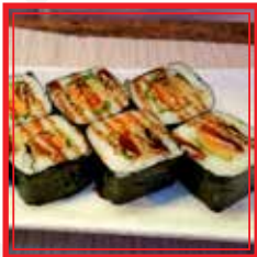
405. FUTO MAKI FRITTO VEGETARIANO patate, zucchine e insalata € 9,00