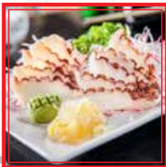
807. SASHIMI TAKO* 10 fette € 8,00