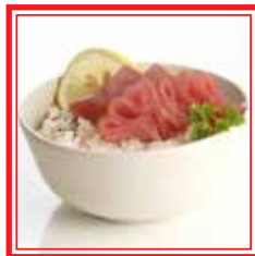
710. CHIRASHI TONNO € 16,00