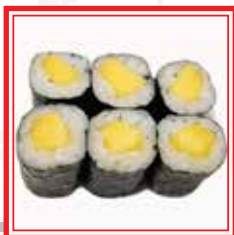
214. MANGO ROLL € 4,00

* PRODOTTI SURGELATI O CONSERVATI A BASSA TEMPERATURA Le foto dei piatti sono puramente indicative e hanno il solo scopo illustrativo.