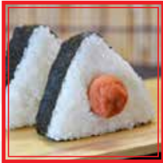
510. UMEBOSHI ONIGIRI prugna secca € 4,00

2pz (polpetta di riso ripiena sostenuta con alga nori)