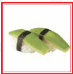
# 509. NIGIRI AVOCADO € 3,00

* PRODOTTI SURGELATI O CONSERVATI A BASSA TEMPERATURA Le foto dei piatti sono puramente indicative e hanno il solo scopo illustrativo.