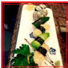
706. SUSHI MISTO VEGETARIANO € 7,00

# PIATTO A SCELTA TRA LE 5 PROPOSTE PER IL MENÙ A PREZZO FISSO DA EURO 25,00