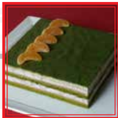
TORTA AL THÈ VERDE € 4,50