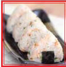
511. ONIGIRI SALMON AVOCADO € 4,50