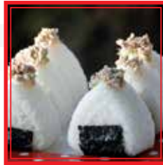
512. ONIGIRI TUNA AVOCADO € 5,00