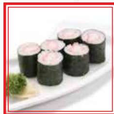
212. HOSO MAKI KANI surimi* € 4,00