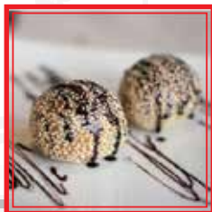
MIX MOCHI DI RISO 4 pezzi € 5,50