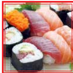
704. SUSHI MISTO GRANDE 6 maki, 12 nigiri € 19,00