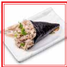
111. TEMAKI TUNA SPECIAL tonno cotto e insalata € 4,00