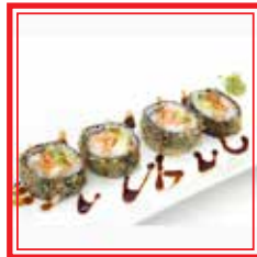
408. FUTO PHILADELPHIA gamberi*, surimi*, tobiko*, philadelphia e avocado € 11,00