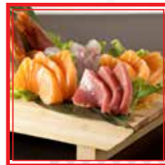
804. SASHIMI MISTO MEDIO 12 fette € 15,00