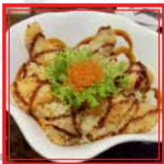
713. CHIRASHI TEMPURA scaglie di tempura, tempura di pesce misto e ikura* € 14,00

# PIATTO A SCELTA TRA LE 5 PROPOSTE PER IL MENÙ A PREZZO FISSO DA EURO 25,00