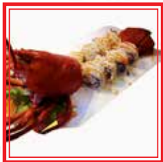
325. URA MAKI ASTICE (su prenotazione) astice, gamberi*, avocado e tobiko* € 25,00