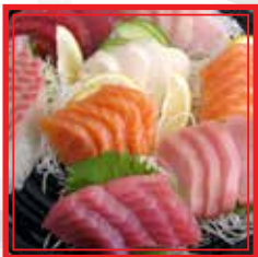
805. SASHIMI MISTO GRANDE 16 fette € 17,50