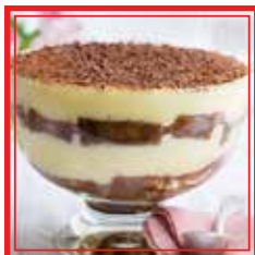
TIRAMISÙ FRESCO AL THÈ VERDE € 3,50