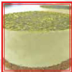
CHEESECAKE AL THÈ VERDE € 4,00