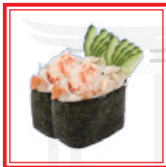
602. GUNKAN KANI surimi* e avocado € 4,00