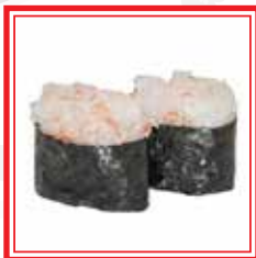
606. GUNKAN AMAEBI gamberi rossi crudi* € 5,50