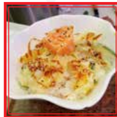
# 712. CHIRASHI MIX salmone e tempura di verdura € 12,00