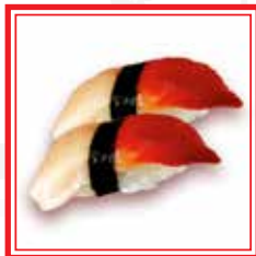
# 503. NIGIRI HOKKIGAI vongole artice* € 3,50