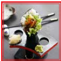
110. TEMAKI UNAGI anguilla*, insalata e avocado € 5,50