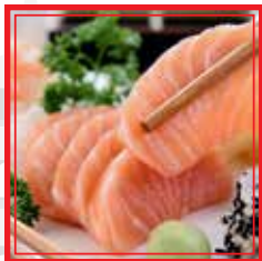
801. SASHIMI SAKE 10 fette € 12,50