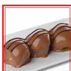
PROFITEROLES € 3,50

* PRODOTTI SURGELATI O CONSERVATI A BASSA TEMPERATURA Le foto dei piatti sono puramente indicative e hanno il solo scopo illustrativo.