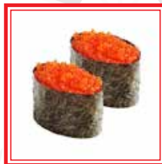
605. GUNKAN TOBIKO caviale di pesce volante* € 4,50